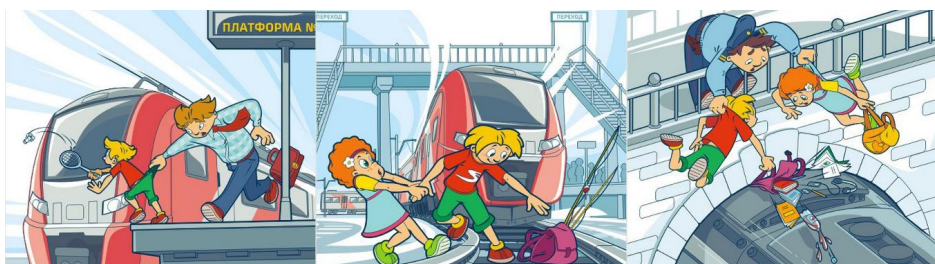
Платформа – не место для игр!

Издание «Газета ярославских старшекласников «В курсе» Адрес редакции и издателя: 150000, Ярославская область, г. Ярославль, ул. Советская, 17 Тел.: (4852)30-93-51 Учредитель: муниципальное образовательное учреждение дополнительного образования «Ярославский городской Дворец пионеров» 150000, Ярославская область, г. Ярославль, ул. Советская, 17 e-mail: young-yar@yandex.ru сайт: http://gcvr.edu.yar.ru Главный редактор: Боковая Д.А., педагог дополнительного образования Выпускающий редактор: Боковая Д.А. редакции в Контакте http://vkontakte.ru/club7938529 и на сайте учреждения Выпуск №1(128) Дата выхода в свет 20.02..2022 Время подписания в печать: 20.02..2022 по графику и фактическое в 10.00 Газета отпечатана в МОУ ДО «Дворец пионеров» Адрес типографии: 150000, Ярославская область, г. Ярославль, ул. Советская, 17