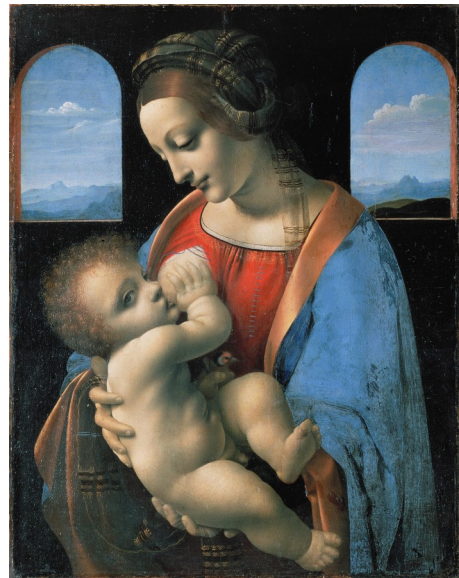
Картина из сети Интернет

В итоге моя поездка закончилась тем, что я 12 часов провел в поезде в плацкарте за чтением очень интересной книги. В ПИТЕРЕ ЖИТЬ!!!!!!