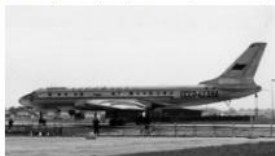
sss (c) Лондон - Хитроу 1960