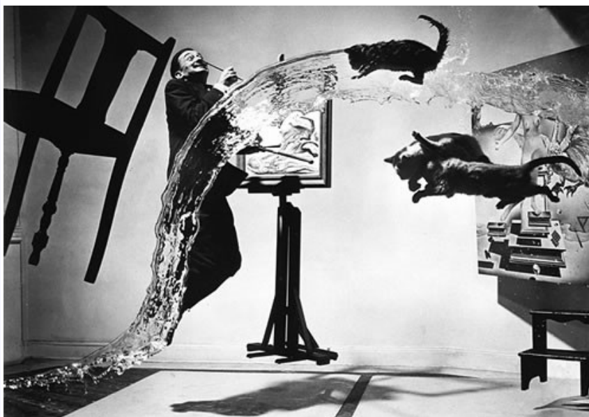
«Атомный Дали», Филипп Хальцман, 1948

Газета издается в рамках реализации программы по развитию социальной активности «Молодой Ярославль на базе Ярославского городского Центра внешкольной работы