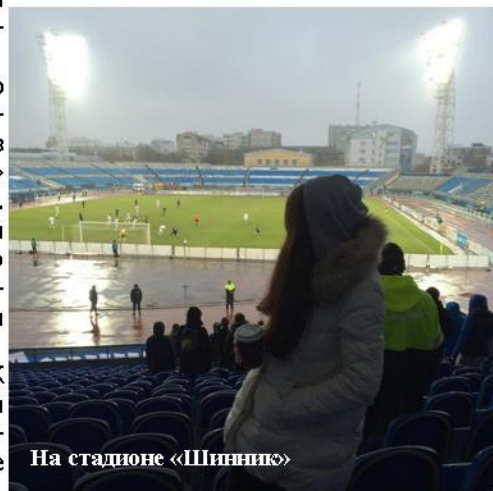
На стадионе «Шинник»