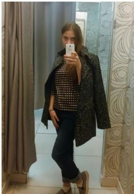
На фото: автор текста

Главное, чтобы нравилось самой себе и было удобно и тепло. Ищите и находите свой стиль! ВК