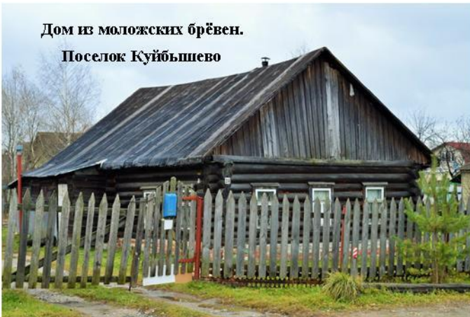
Дом из моложских брёвен. Поселок Куйбышево

Небольшое село «Куйбышево» — это непросто отдаленная местность города Ярославля, но и место памяти. Там находится дача нашей семьи, где мы часто проводим время: отдыхаем, работаем и просто собираемся на семейные вечера. Наш дом не отличается роскошными фасадами, гравировкой и красивой покраской, но он дорог нам, потому что хранит память о самых дорогих нам людях.