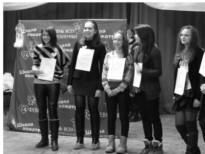
Мероприятие прошло на ура. Корреспонденты (мы) в курсе.