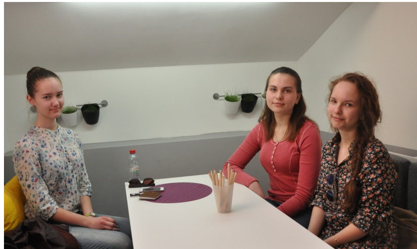
«7 вопросов, которые мы задали...»

Сколько стоит? 1 ч -2р/мин, 2 ч-1,5р/мин 390р-максимальная цена, которую вы можете заплатить за день.