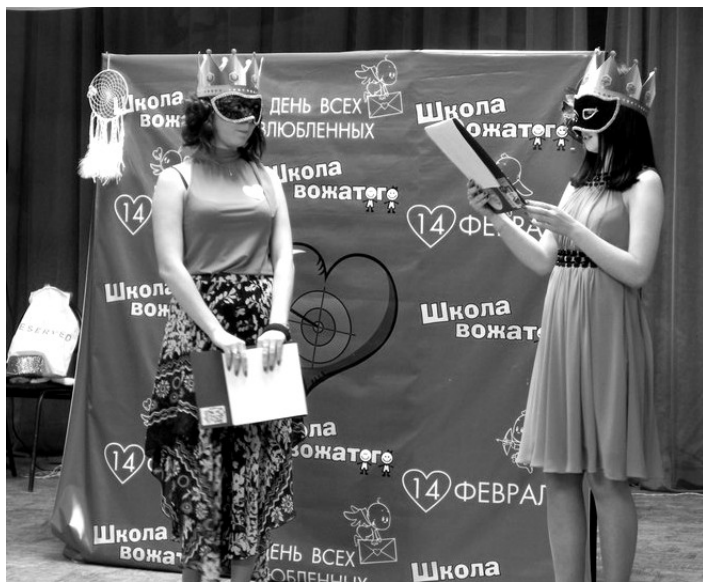
В каждой девушке должна быть загадка и обаяние. Эти очаровательные ведущие в образе принцесс создавали романтическое настроение в течение всего вечера.