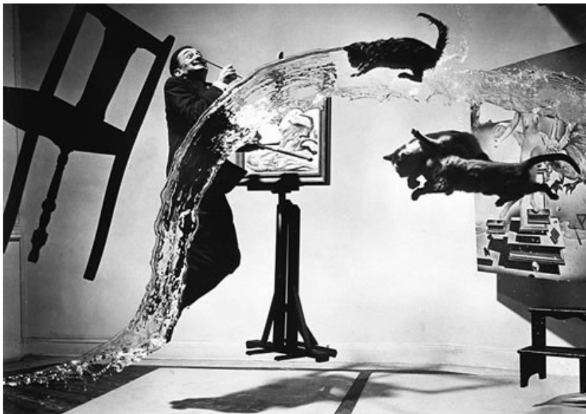
«Атомный Дали», Филипп Хальцман, 1948

Газета издается в рамках реализации программы по развитию социальной активности «Молодой Ярославль на базе Ярославского городского Центра внешкольной работы