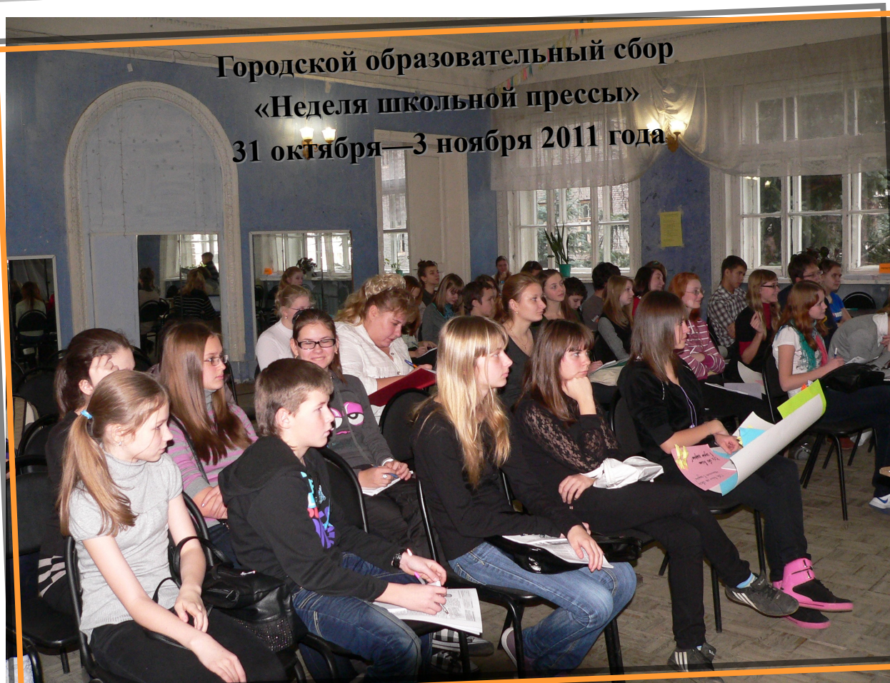
Городской образовательный сбор «Неделя школьной прессы» 31 октября—3 ноября 2011 года