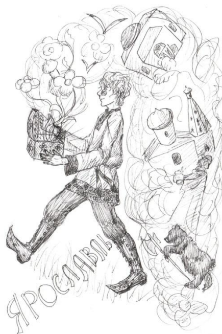
Автор иллюстрации Помоголова Дарья

О том пел, как приятнейше с коробочкой идти, О том, что его гражданам с ним явно по пути. И, знаете, я вам скажу без всякого вранья: О милом городе родном поет душа моя!