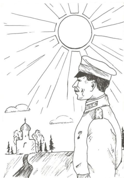
Автор иллюстрации Мерзенёва Евгения

Так что же делать нам, моя Россия? Идти вперед! У Бога не просить! Меняться должен каждый, становиться сильным. Мы не хотим Россию хоронить.