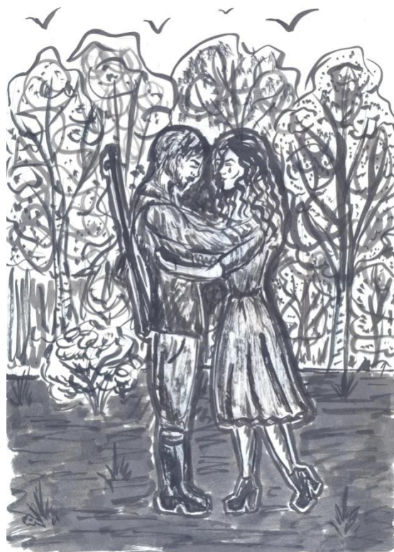
Автор иллюстрации Ларионова Анастасия

Пусть же история помнит вечно Этот суровый урок,