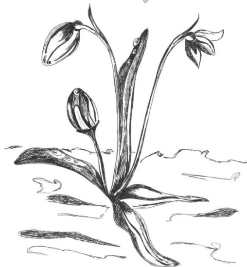
Автор иллюстрации Скобелева Анастасия