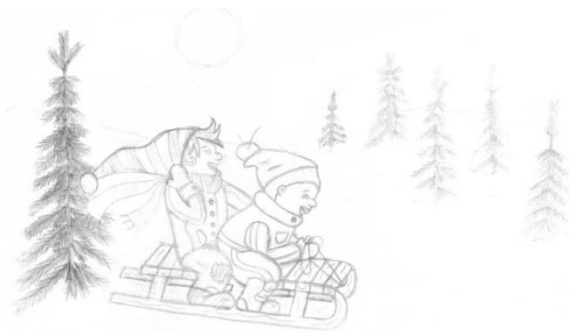
Автор иллюстрации Терехин Алексей