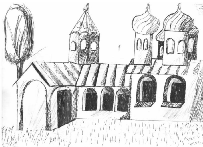
Автор иллюстрации Ашаева Диана

Я, может быть, когда-нибудь уеду, А, может быть, и мир весь обойду, Но города прекрасней и роднее, Я на планете нашей не найду!