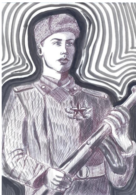
Автор иллюстрации Ларионова Анастасия

И горжусь тем, что часть я великой страны, Той, что честью своей дорожит. Не продам ни за что я родной стороны, Моё сердце лишь с нею лежит.