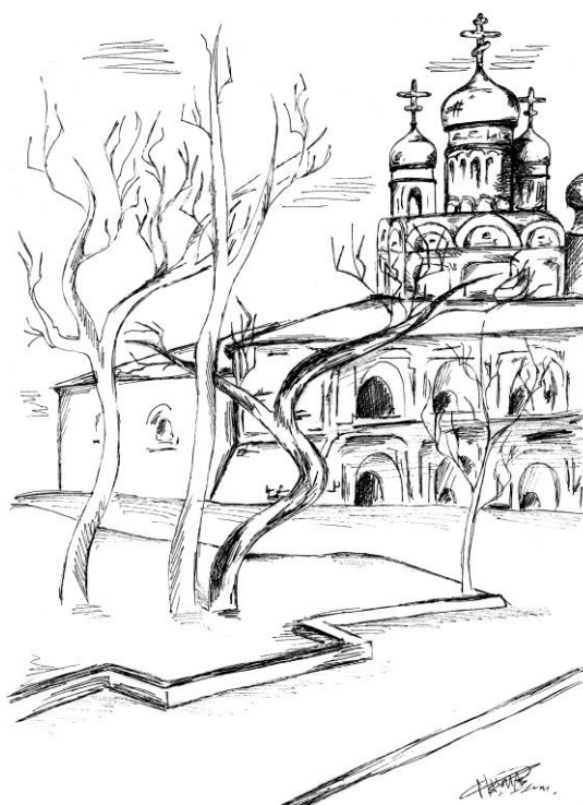
Автор иллюстрации Анисимова Мария

Не тревожат сердце дальние края, Всё это – Россия, Родина моя!