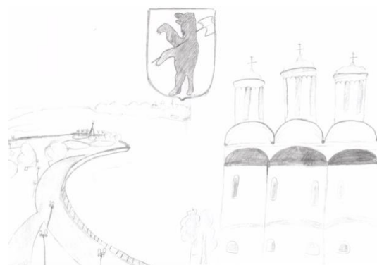
Автор иллюстрации Хапаева Арина

Вот я, небольшая, лихая девчушка, Учусь ещё в школе, мне мало годков, Но знаю, что города нашего лучше Трудно найти средь других городов.