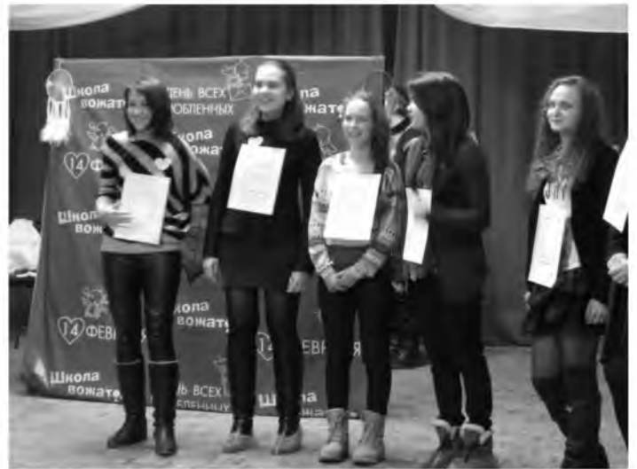
Мероприятие прошло на ура. Корреспонденты (мы) в курсе.