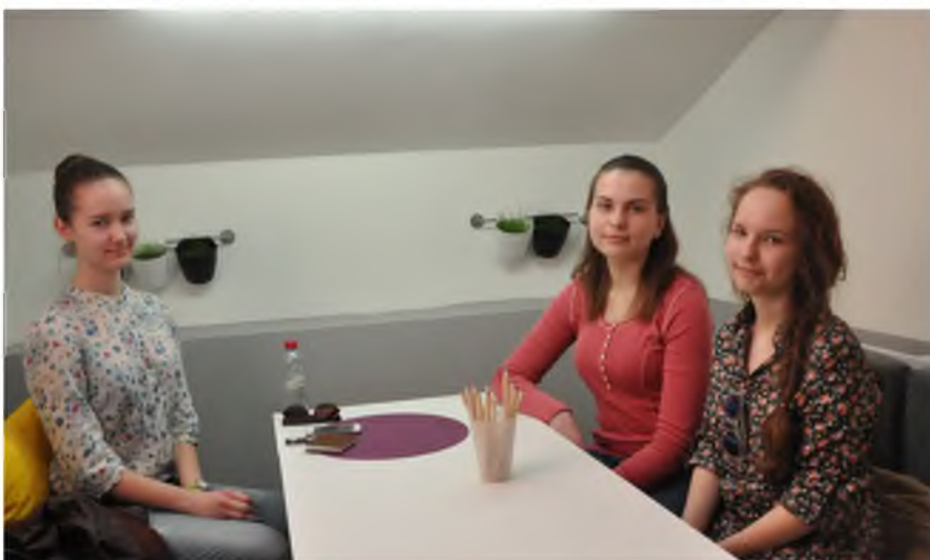
«7 вопросов, которые мы задали...»

Сколько стоит? 1 ч -2р/мин, 2 ч-1.5р/мин 390р-максимальная цена, которую вы можете заплатить за день.