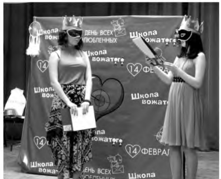
В каждой девушке должна быть загадка и обаяние. Эти очаровательные ведущие в образе принцесс создавали романтическое настроение в течение всего вечера.