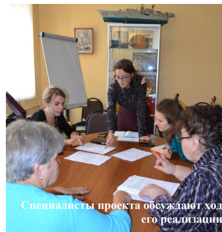
Специалисты проекта обсуждают ход его реализации

Теперь я не просто скучающая одиннадцатиклассница, переживающая из-за ЕГЭ, я руководитель добровольческого проекта, финансовый директор, организатор, куратор... Очевидно, скучно теперь не будет. До встречи на спектаклях «Беззвучного театра».