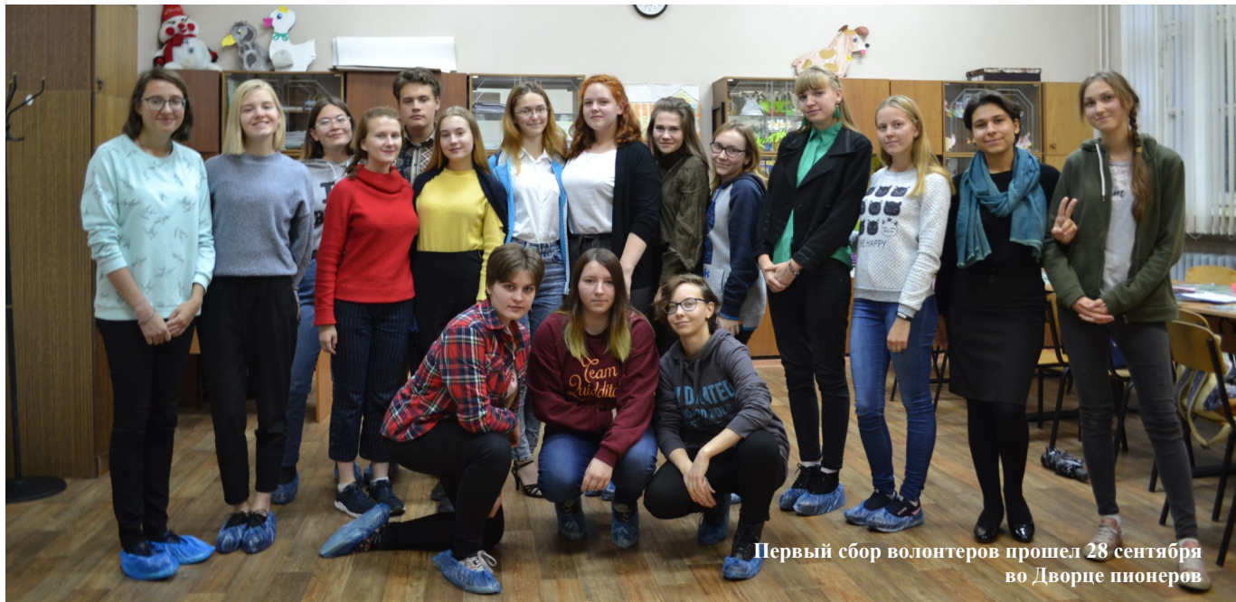
Первый сбор волонтеров прошел 28 сентября во Дворце пионеров

Текст — Кира Батяева