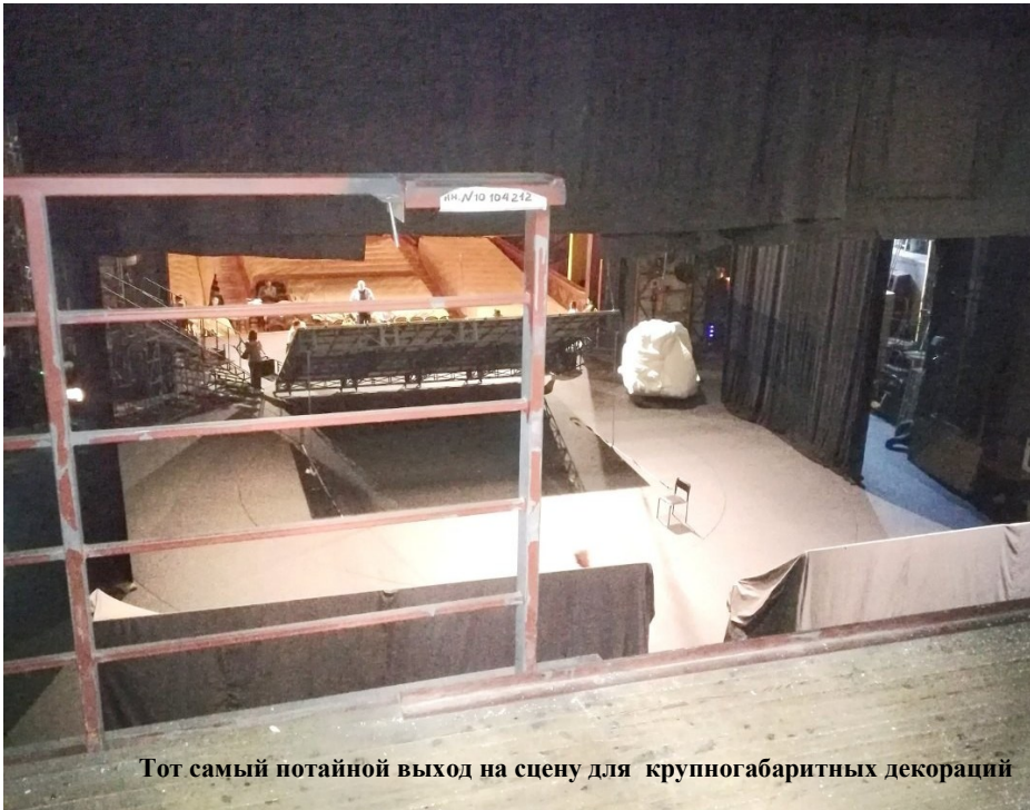
Тот самый потайной выход на сцену для крупногабаритных декораций