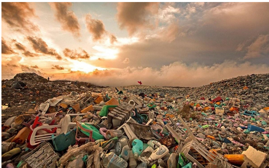
Картинка из сети Интернет