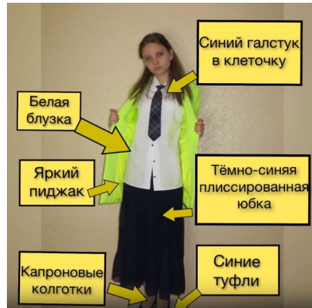
Картинка из видео автора