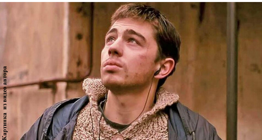
Картинка из видео автора