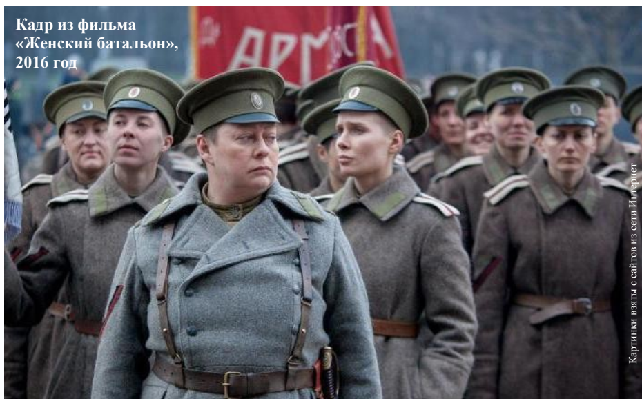
Кадр из фильма «Женский батальон», 2016 год

Картинки взяты с сайтов из сети Интернет