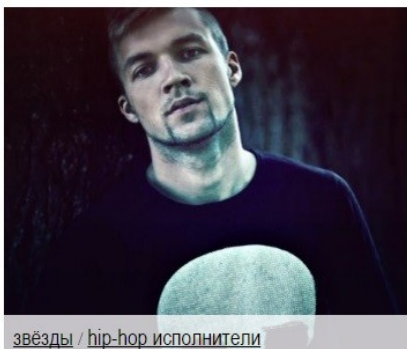
звёзды / hip-hop исполнители

После концерта, когда большинство фанатов уже успели повизжать впопыхи и кинуться на шею своему кумиру, будто бы он не человек, а редкий экспонат музея, НОМIE уже выглядел совершенно измотанным и уставшим. Казалось, что его размашистая подпись и ослепляющий свет софитов уже успели превратиться в некий плен, из-за чего его песни затронули меня ещё больше, а уважение к этому человеку возросло в разы.