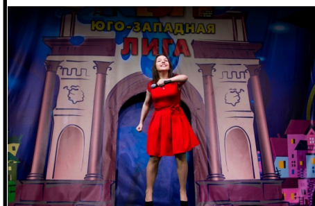
Фото ангора из сети «В контакте»

Всё новые и новые команды начинают свой путь. Безумные репетиции, проблемы с декорациями, поиски массовки. Для кого-то это муторная работа, а для кого-то вся жизнь. И я считаю правильным, что этой жизни людей не лишают, а поддерживают и помогают развиваться, организовывая подобные мероприятия.