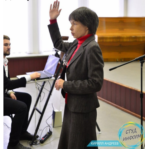
Регистрация участников. Библиотека им. Н.А. Некрасова