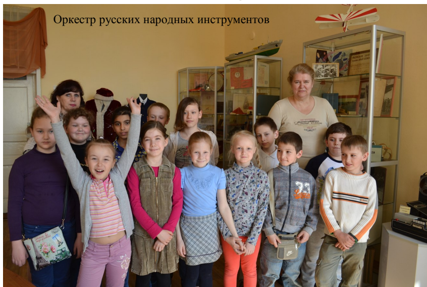
Оркестр русских народных инструментов