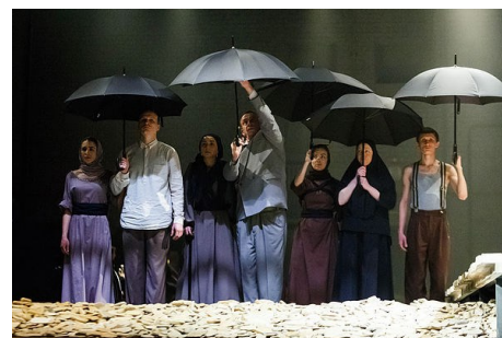
Российский государственный академический театр драмы имени Федора Волкова, Ярославль «Гроза», Александр Островский. Режиссер Денис Азаров