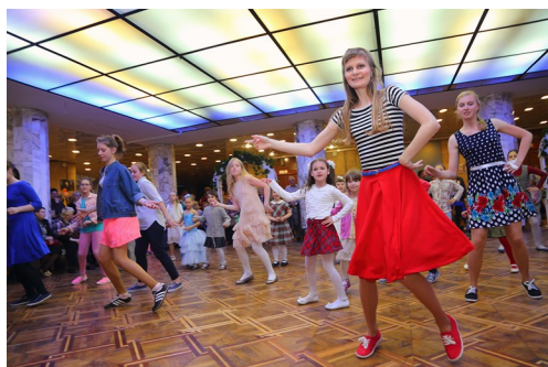
Танец буги-вуги танцуют все