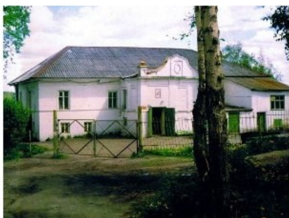
Норско-посадское двухклассное министерское училище "Каменка" 1867 год постройки

Гордостью поселка Норское Дзержинского района по праву считается средняя школа № 17, которая ведет свою историю с 1860 года с открытия двухклассного посадского училища. Образовательное учреждение меняло названия и здания, но никогда не прекращало работу и поэтому не потеряло дух классического образования, что позволяет по праву считать ее старейшим образовательным учреждением города Ярославля.