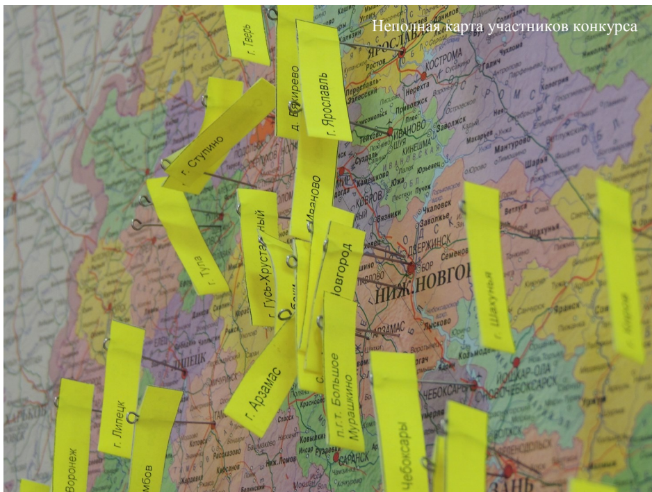
Неполная карта участников конкурса

9 апреля на факультете журналистики Московского государственного университета (МГУ) им. М.В. Ломоносова проходила торжественная церемония подведения итогов Фестиваля школьных СМИ – 2016.