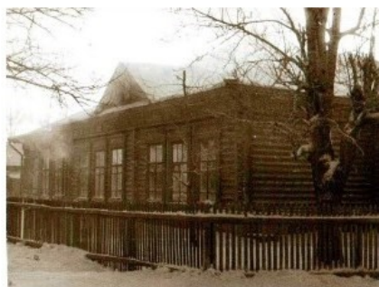
Министерское четырёхклассное училище 1901 год постройки