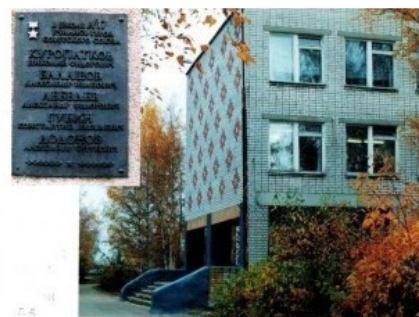
Средняя школа № 17 города Ярославля 1978 год постройки