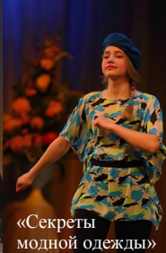
«Секреты модной одежды»