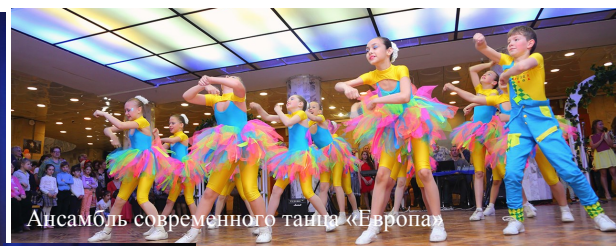
Ансамбль современного танца «Европа»