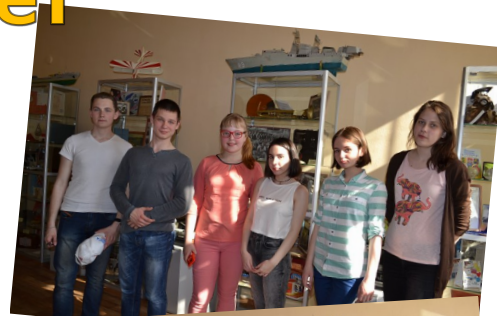
Участники игры «Подарки для Дворца»

Стенды отображают то, как в течение многих лет менялся облик Дворца, начиная с первых рисунков и статей, и заканчивая международными обменами и научными достижениями. Каждый желающий может посетить музей или пополнить его фонды.