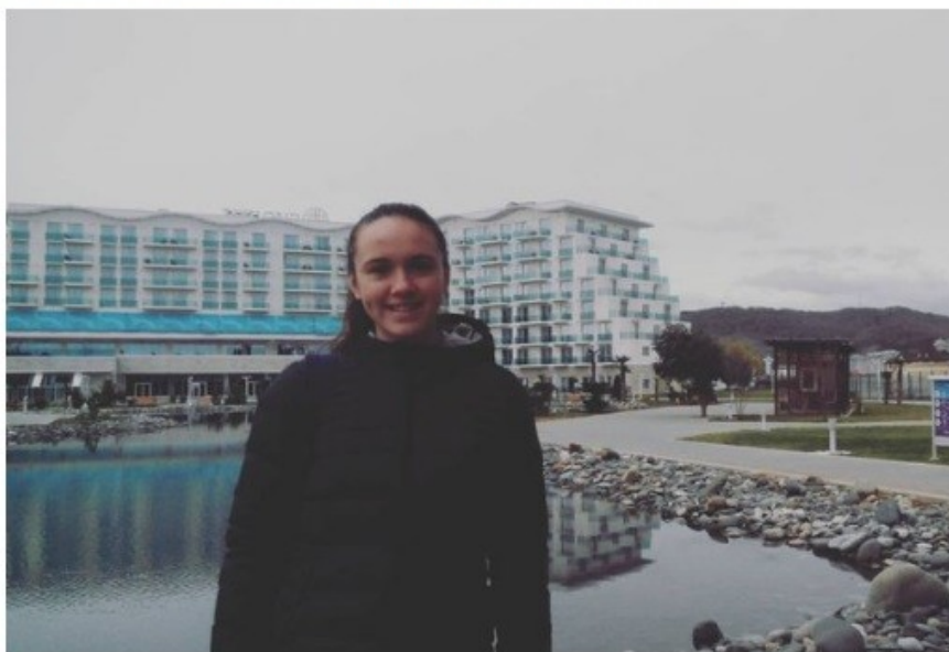
Олимпийский проспект, Большой Сочи