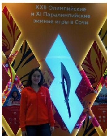
Олимпийский проспект, Большой Сочи

Тот самый олимпийский огонь находится в Образовательном Центре для одаренных детей "Сириус" в Сочи. Здесь я учусь на направлении "Литература". #СочиСириус#Олимпийскийогонь#счастье#радость#учеба #литература#мечты#сбываются @ Сириус