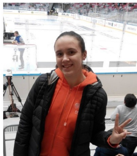
Олимпийский проспект, Сочи

Что же делает Сириус в перерыве? - фотографии на память) #СочиСириус#хоккей#Акбарс#Сочи#отдых @ Большая Ледовая Арена для Хоккея С Шайбой