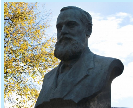
Бюст Л. Трефолеву установлен в сквере на ул. Трефолева

Трефолев напомнил ярославцам, что в 1786 здесь вышел в свет первый провинциальный журнал «Уединенный пошехонец».