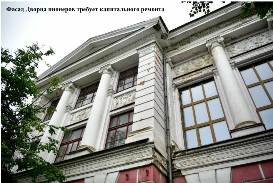
Фасад Дворца пионеров требует капитального ремонта

Со стороны здание выглядит красивым, большим, могущественным. Меня с первого взгляда впечатлила его архитектура: белые колонны, рельефные наличники, деревянные окна. Это всё выглядит красиво и гармонично. Оказалось, что здание построено в начале XX века, и за уже вековую историю накопило много всего интересного. Мне видится в нём какая-то загадочность старины, но в то же время это и центр детской и молодежной жизни города.