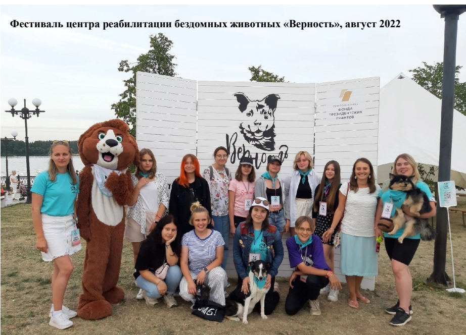
Фестиваль центра реабилитации бездомных животных «Верность», август 2022

Маленькие идеи могут принести большое благо другим людям. В конце того учебного года наш волонтерский отряд должен был провести мероприятие, чтобы показать, чему мы научились за год. Мы решили, что назовани-