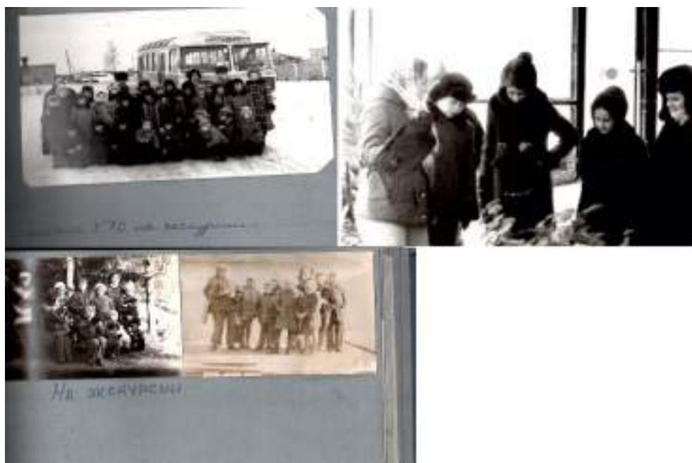
Учащиеся кружка «Юный натуралист» на экскурсиях.