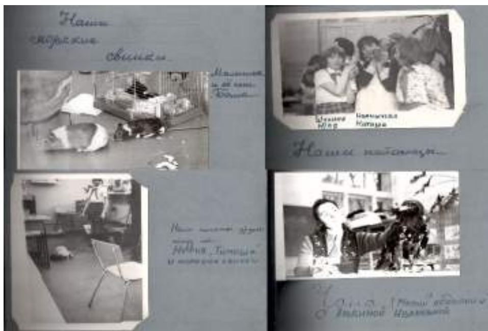
Животные, которые обитали в «живом уголке» «Юного натуралиста».