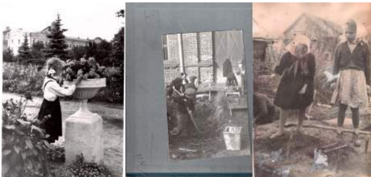
Уборка сада и огорода.