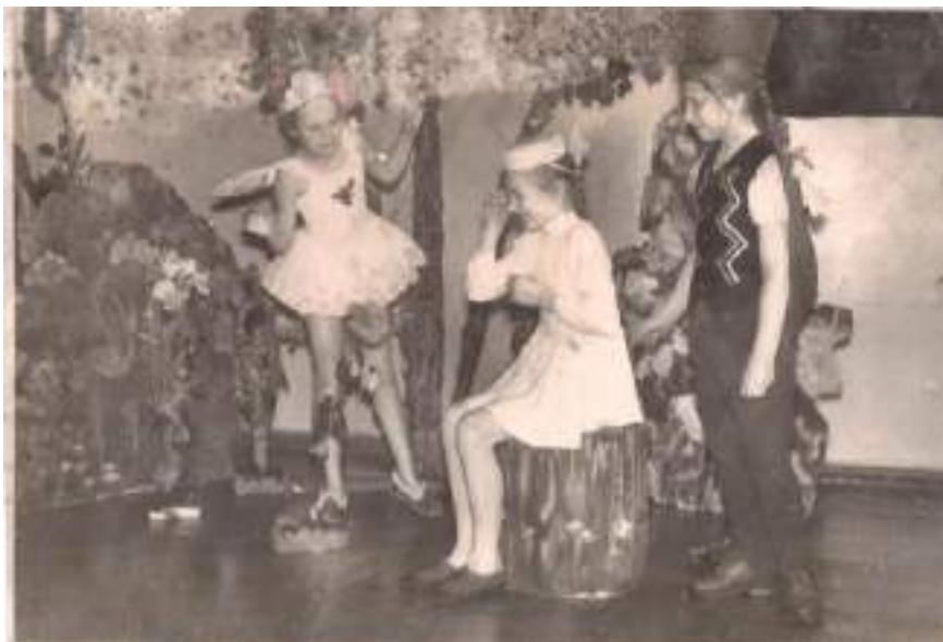
Театральная постановка.