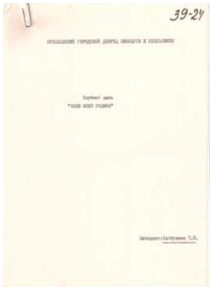
Титульный лист сценария клубного дня «Хлеб моей родины». Из архива Ярославского городского Дворца пионеров.