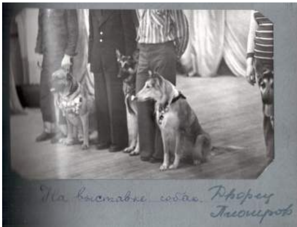
Выставка собак. Из архива Ярославского городского Дворца пионеров – демонстрационный альбом кружка «Юный натуралист».