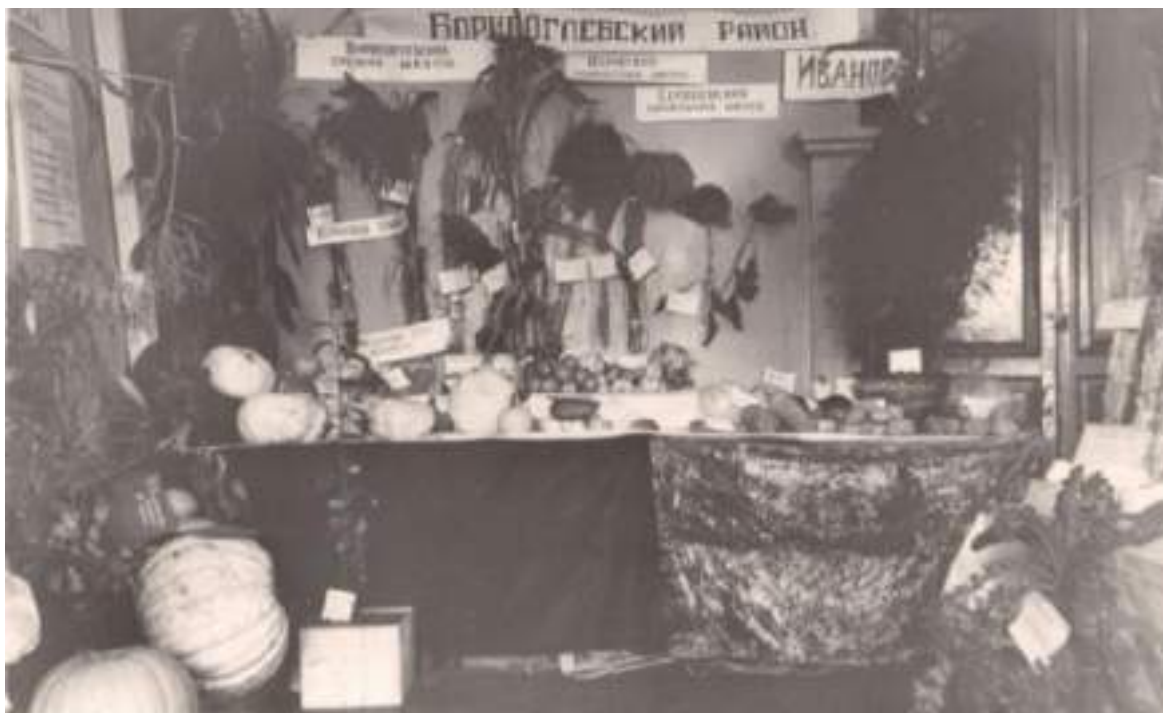
Сельскохозяйственная ярмарка.