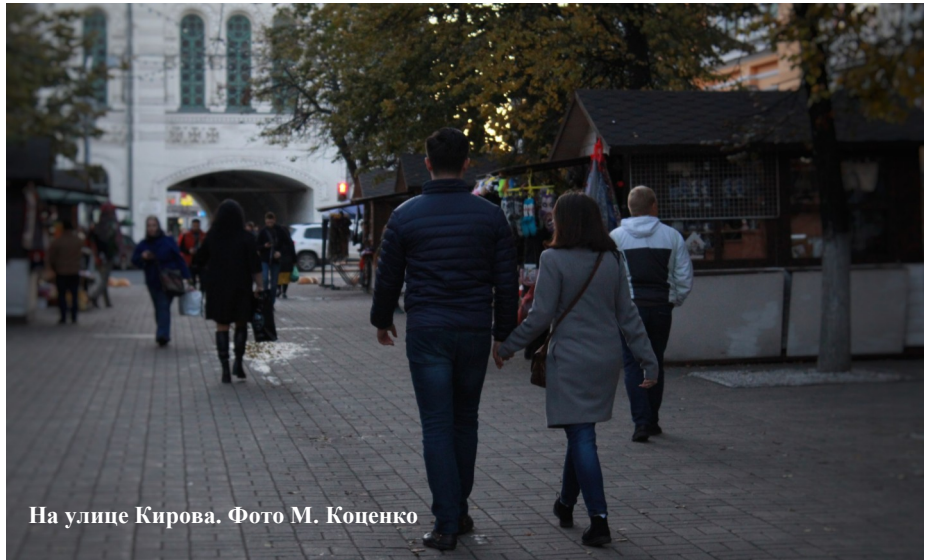
На улице Кирова.

Возвращалась я домой счастливой. После спонтанной прогулки на душе стало светло, тепло и уютно. С того дня осталось много фотографий, которые до сих пор излучают море позитива.