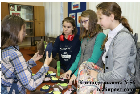
Команда школы №56 выбирает сову

На самом деле, любая интеллектуальная игра – не только много новой полезной информации, приятные плюшки в конце, но и развитие коммуникативных навыков каждого: между прочим, работа в команде – непростая вещь!