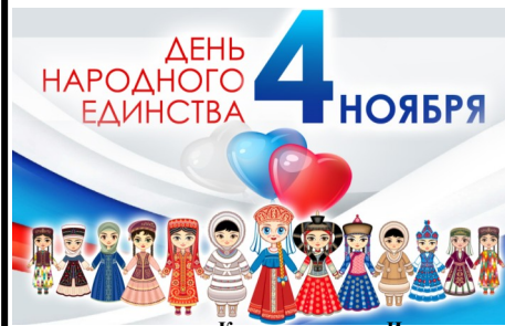
Картинка из сети Интернет

Написанный 120 лет назад рассказ «О любви». Все также актуален: он повествует о людях, способных любить, но не способных признаться в своих чувствах, о людях, способных жить в своей раковине, но не способных мечтать; это все те же люди, разве что, немного сухие и равнодушные – люди 120 лет назад и люди сейчас. Человечество прожило немного больше века, но нравы мало поменялись: увы, но Чехов знал, о чем писать – об обыденности, о привычках и молчании; это книга с людьми, с историей и – со смыслом.