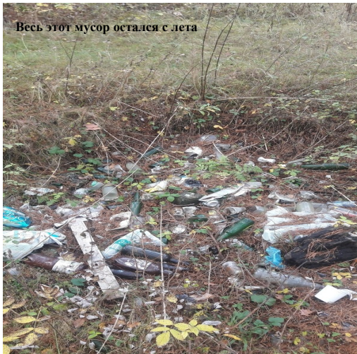
Весь этот мусор остался с лета

Поэтому призываю всех если не активно участвовать в акциях по сбору мусора, то хотя бы не вредить. Эта земля принадлежала вашим предкам, и будет принадлежать вашим же потомкам. Не стоит порочить память былых поколений и отягощать жизнь будущих поколений своими отходами.