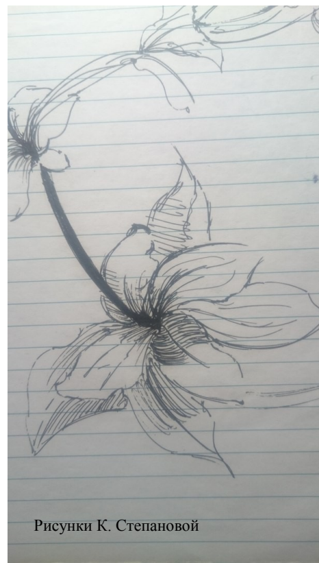
Рисунки К. Степановой

Издание «Газета ярославских старшекласников «В курсе» Адрес редакции и издателя: 150000, Ярославская область, г. Ярославль, ул. Советская, 17 Тел.: (4852)30-93-51